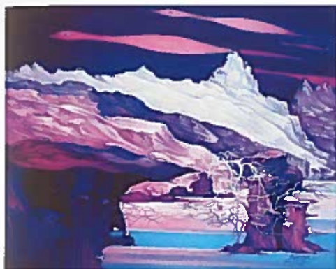
The Rocks Wake Up olio su tela, cm 61x76

Contatti/Recapiti: Via di Borgo Raffano, 1 - 42048 Rubiera (RE) Cell 335 6097323 E-mail: bedocchioferruccio1@gmail.com