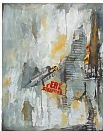
Impronte di vita tecnica mista su tela, cm 40x50

Contatti/Recapiti: 76109 Fort Worth - Texas (USA) Cell +1 6824141952 - E-mail: davidbeeri@gmail.com - www.davidbeeri.com Galleria di riferimento: Hungarian Cultural Institution (Budapest), Crocetti Museum (Roma) Nishida Museum (Giappone), Oud Sint Jan Museum (Bruges), Ruhr Gallery (Germania)